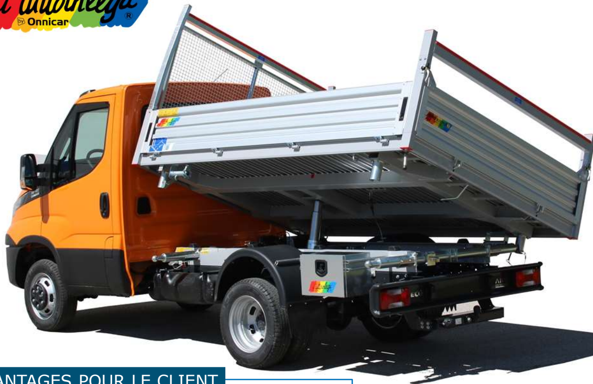
Illustration à titre indicatif - Non contractuel